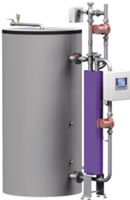
EHRE (inkl. Speicher)