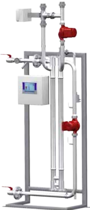
EHRE (exkl. Speicher)