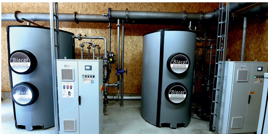
2 x Biotat KS 25D mit Kalkschutzwirkung auf Basis der Biomineralisierung